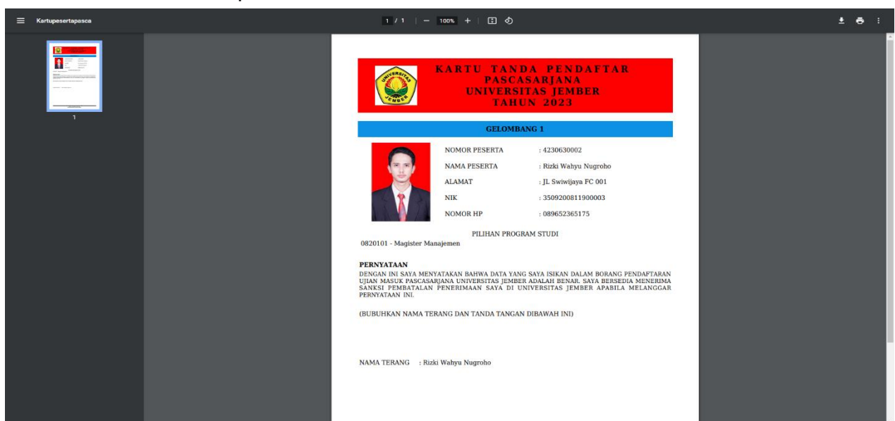
Gambar 14. Kartu Peserta.

14. Setelah menekan tombol Cetak , maka sistem akan menampilkan dokumen kartupeserta.